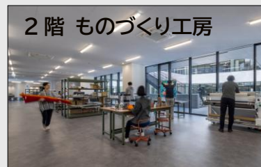
2階 ものづくり工房